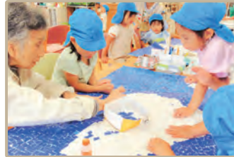
保育園児との交流